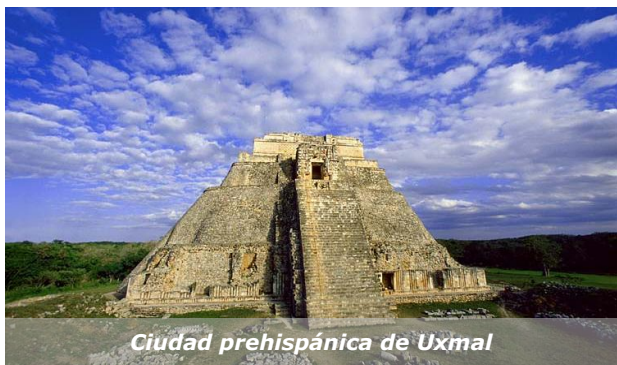
Ciudad prehispánica de Uxmal

Aunque los elevadores de obras de construcción están excluidos del ámbito de aplicación de la norma, ésta puede ser de utilidad para su diseño y fabricación.