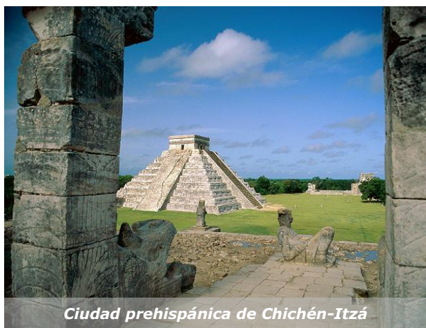
Ciudad prehispánica de Chichén-Itzá

Si al producto a importar no le es aplicable ninguna Norma NOM, la Secretaría de Economía podrá requerir que los productos que se vayan a importar ostenten las especificaciones internacionales con que cumplen, las del país de origen o a falta de éstas, las del fabricante.