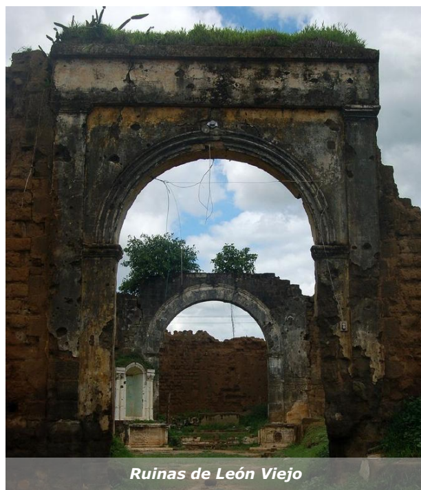
Ruinas de León Viejo