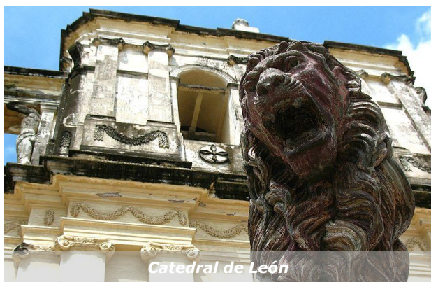
Catedral de León

La Comisión Nacional de Normalización Técnica y Calidad (CNNC), máximo organismo del Sistema Nacional de la Calidad (SNC), es responsable de coordinar las políticas y programas nacionales de normalización y acreditación, para lo que cuenta con el apoyo técnico de la Dirección Técnica de Normalización y Metrología.