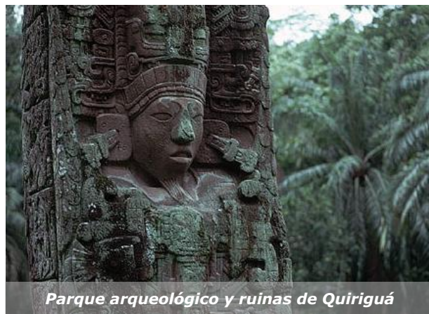
Parque arqueológico y ruinas de Quiriguá

Esta ley disponía que COGUANOR era el organismo responsable de elaborar dos tipos de normas: Normas Guatemaltecas Obligatorias (NGO) y Normas Guatemaltecas Recomendadas (NGR).