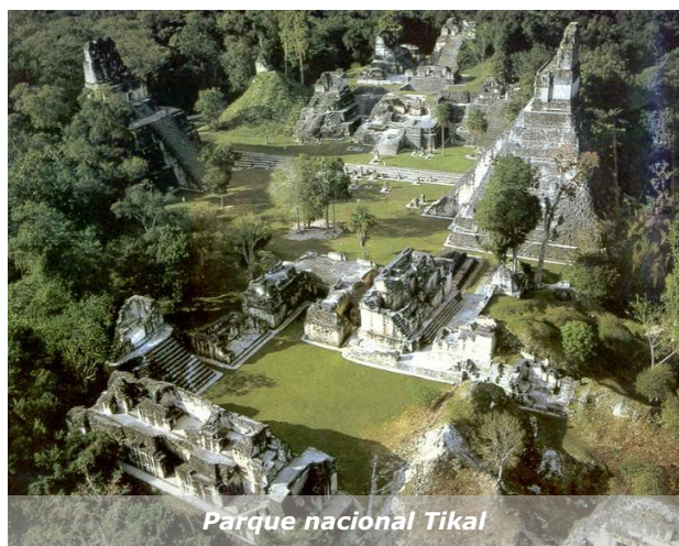
Parque nacional Tikal

A partir de la entrada en vigor en 2006 de la Ley del Sistema Nacional de la Calidad, la responsabilidad de elaborar los reglamentos técnicos aplicables a productos que se elaboren o comercialicen en el país pasó a ser de los Ministerios e Instituciones del Estado competentes en la materia objeto de regulación.